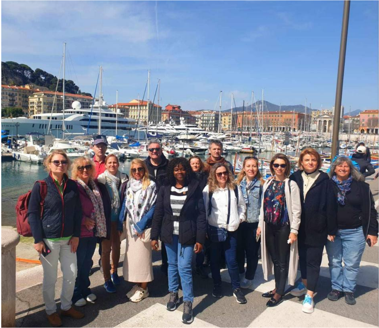
Az este során egy Nizzában élő volt tanítványommal is találkoztam, akivel átsétáltunk a környék leggazdagabb kisvárosába, Villefranche-sur-Mer-be.