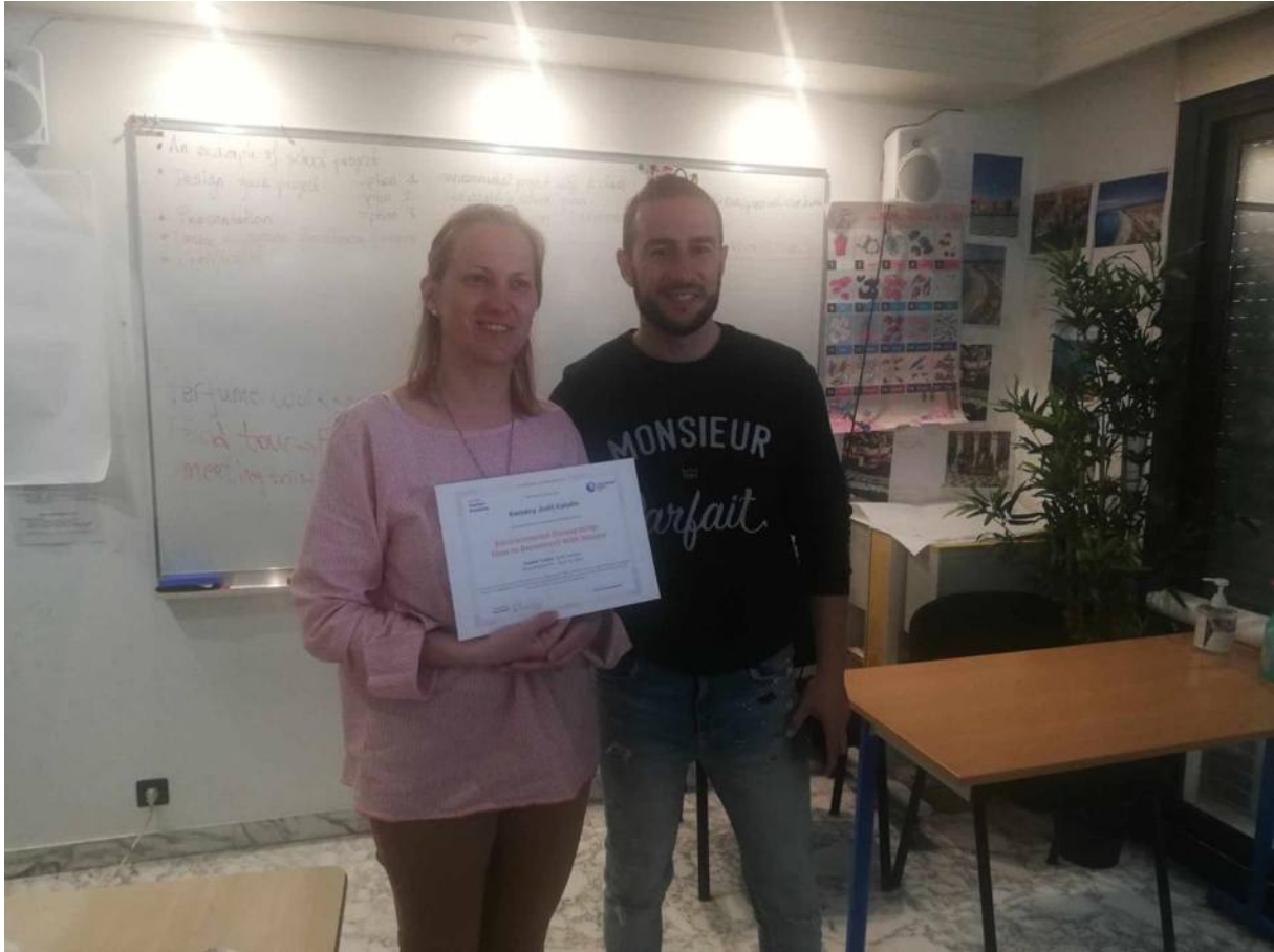
Az utolsó napom délutánját Cannes-ban töltöttem a román lánnyal, akivel nagyon szoros baráti viszony alakult ki.