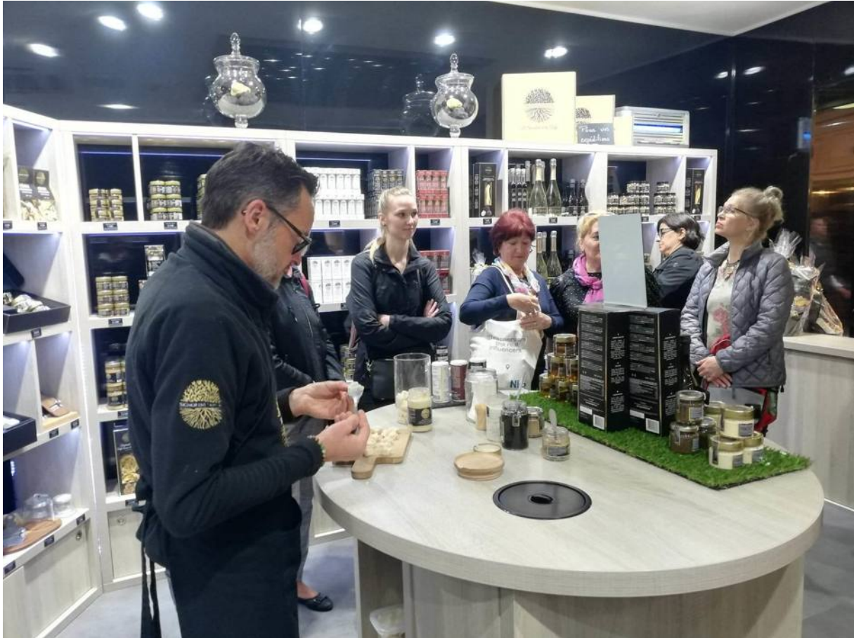
A nap hátralévő részében két kurzus résztvevővel Monaco-ba utaztunk, ahol a gyönyörű környezet megcsodálása mellett az Oceanográfiai Múzeumban tettünk látogatást.